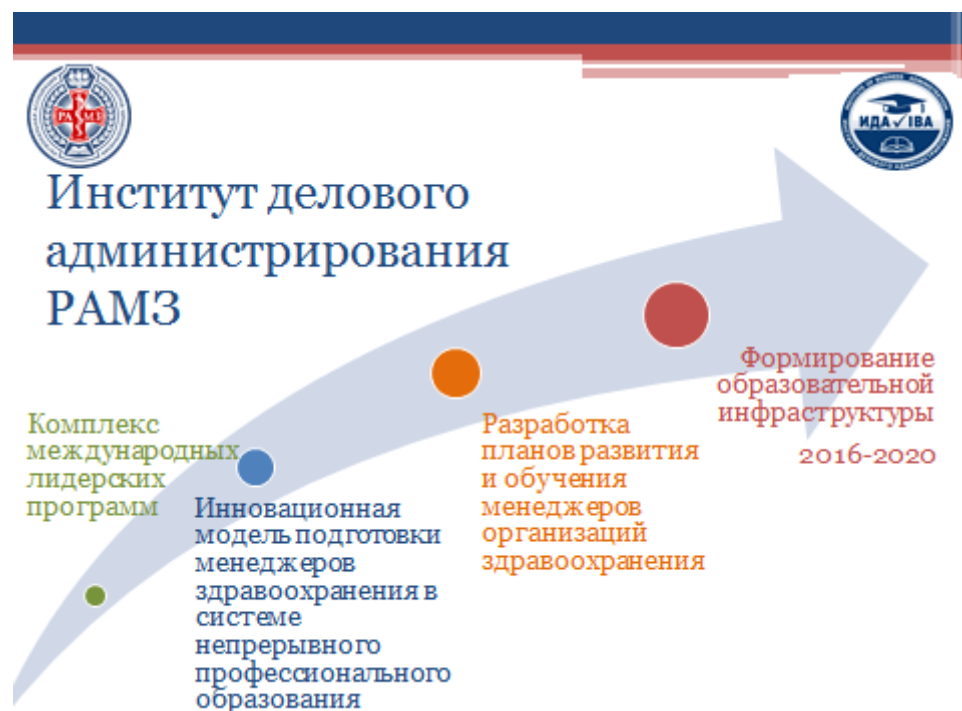
Рис. 2. Модель формирования образовательной инфраструктуры медицинской организации

В ИДА РАМЗ разработана концептуальная модель формирования образовательной инфраструктуры медицинской организации (рис. 2).